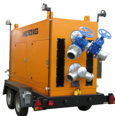
DIVA 350 mit Vollausrüstung