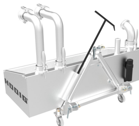
Aufnahmemöglichkeiten für Zubehör