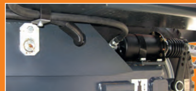
Gebremstes Fahrgestell Iromat V