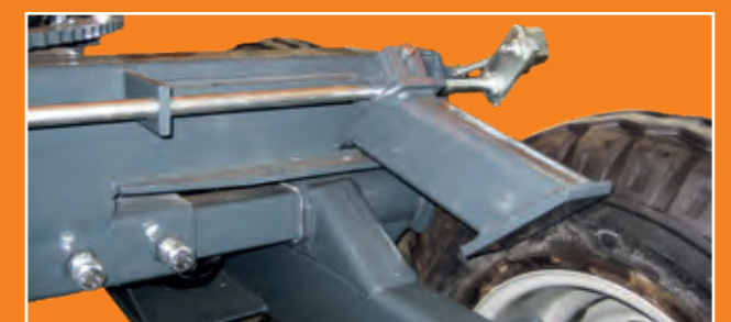
Pendelarretierung für Tandemachse