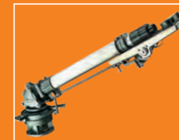
Großflächenregner von Komet