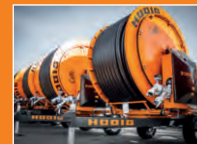
Beregnungsmaschinen in voller Größe