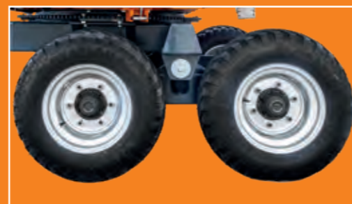
Tandemachse Iromat III