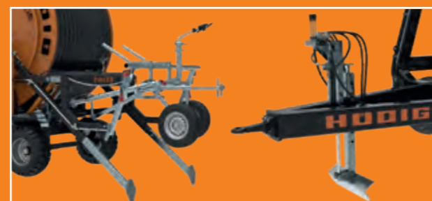
Hydraulische Stützfüße hinten (Standard)