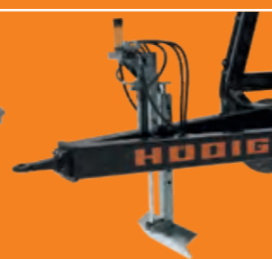
Hydraulischer Stützfuß vorn (optional)