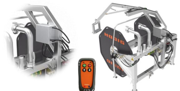
Schlauchhaspel mit Ausleger inkl. optionaler Funk-Fernbedienung zum komfortablen Ansteuern des Auslegers aus der Kabine des Schleppers.

Technische Änderungen sowie Änderungen des Lieferumfanges vorbehalten!