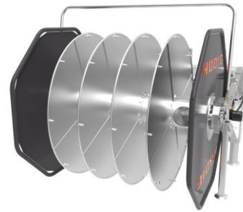
Schlauchhaspel mit montierten Stecksegmenten