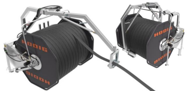
Schlauchhaspel mit Ausleger zum exakten Aufnehmen und Ablegen des Flachschauches