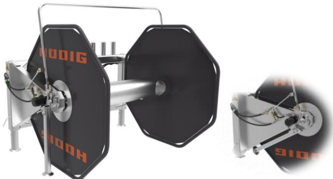
Schlauchhaspel 1000m - Ø100mm in Standardausführung