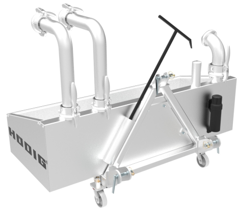
Aufnahmemöglichkeiten für Zubehör