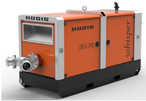
DIVA 350 whisper