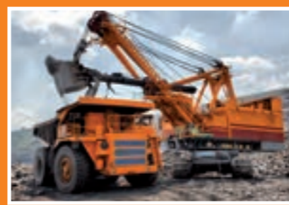
Reinigung von Baufahrzeugen