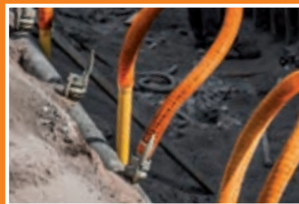
Einspülen von Filtern