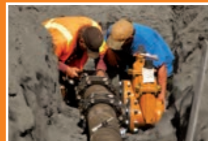
Wasserversorgung beim Bau