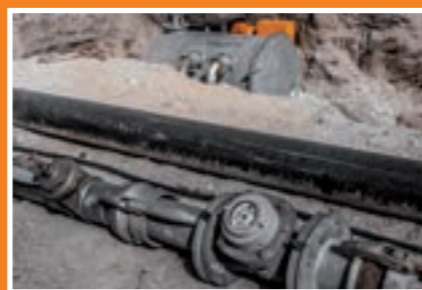
Füllen von Rohrleitungen